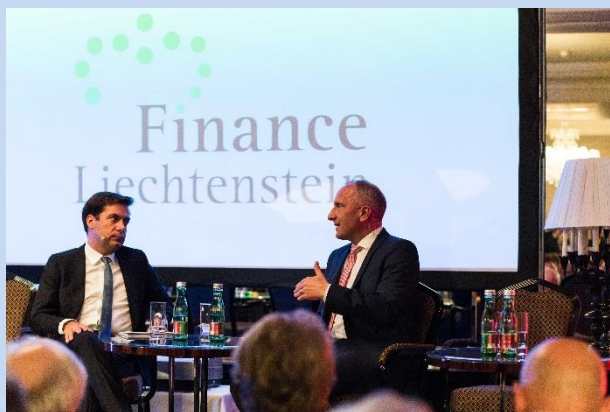
"Presse"-Chefredakteur und Herausgeber Rainer Nowak sowie Liechtensteins Regierungschef und Finanzminister Adrian Hasler

Am 16. Mai 2017 lud der Finanzplatz Liechtenstein in Wien Marktteilnehmer und Investoren zu einem Abend mit Univ.-Prof. Dr. Ewald Nowotny, Gouverneur der Oesterreichischen Nationalbank, S.D. Prinz Michael von und zu Liechtenstein und dem liechtensteinischen Regierungschef und Finanzminister Adrian Hasler ein.