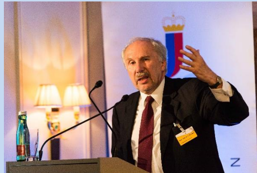
Univ.-Prof. Dr. Ewald Nowotny, Gouverneur der Oesterreichischen Nationalbank

Der Saal des Hotel Bristol war mit über 150 Teilnehmern restlos ausgebucht. Beide Seiten, sowohl Gäste als auch Gastgeber, zeigten sich beeindruckt und freuten sich über einen gelungenen Abend mit interessanten Informationen und vielen neuen Kontakten.